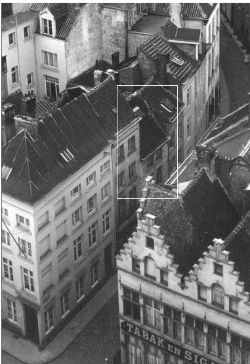
Fragment van een panoramisch gezicht vanuit de Sint-Carolus Borromeuskerk (SAA)