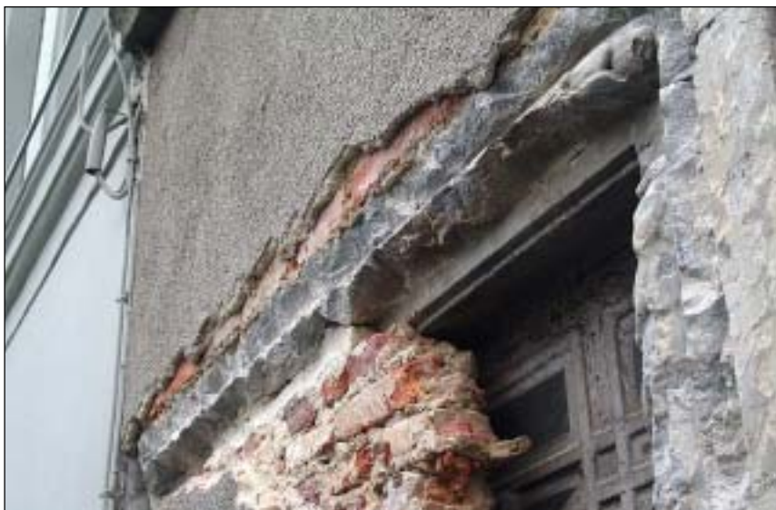
Gedeeltelijk vrijgelegd bovenlicht, met barst in het linteel.