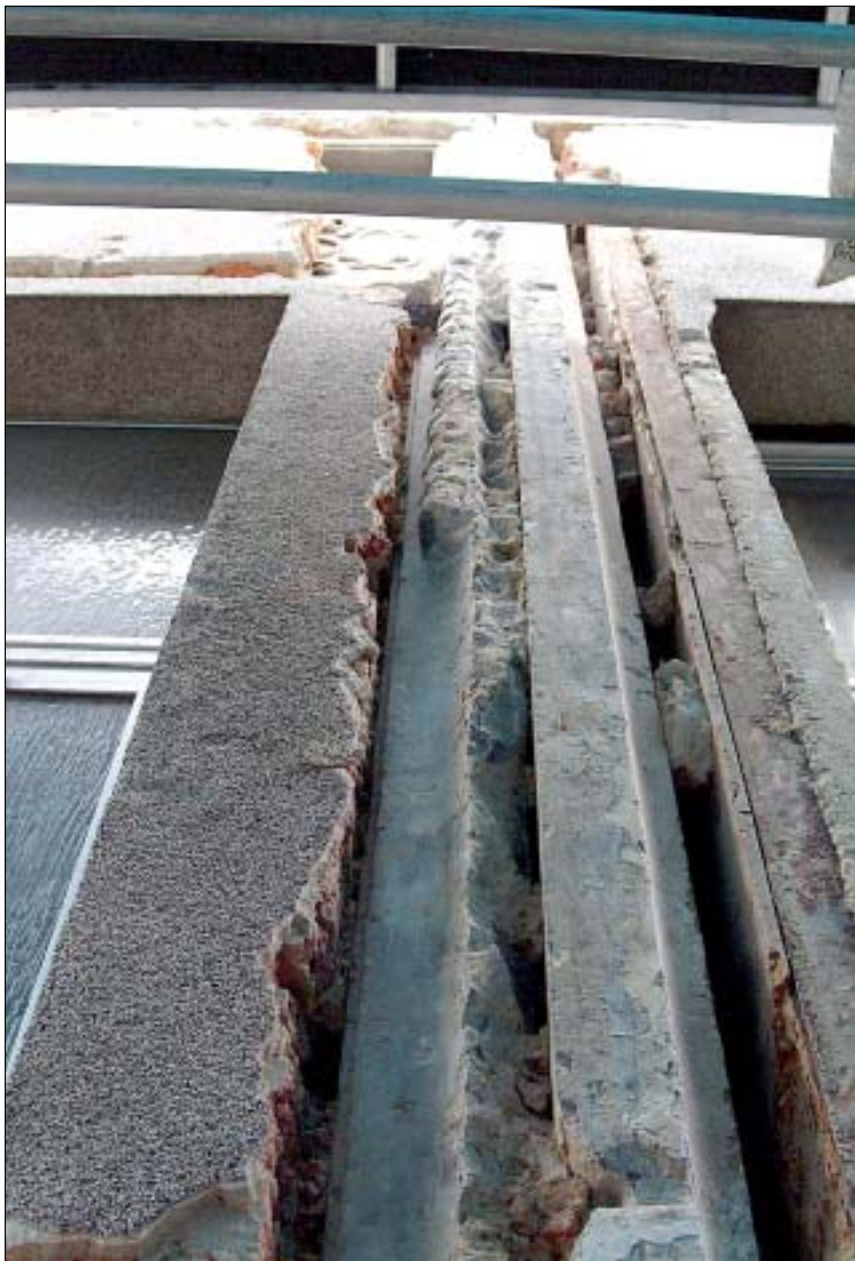
De rechterzone van de ingangsomlijsting, met rechts ervan de bewaarde raamomlijsting.