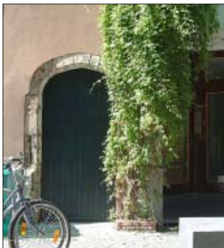
Poortje in de Leeuwenstraat.