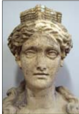
'Antverpia': Collectie Museum Vleeshuis, Antwerpen.

Enkele saters, een Scaldis en een heuse Antverpia uit het Antwerpse stadspatrimonium, stonden recent in de kijker tijdens de Erfgoeddag in de afdeling Conservatie/Restauratie van de Academie (22 april 2007) 1 . Onder het motto ' Niet te schatten ' konden bezoekers deze fragmenten bouwsculptuur, uit respectievelijk het huis 'De Moelner' (Sint-Jacobsmarkt) 2 en een pand aan de verdwenen Mattenstraat 3 , dubbel herzien . Letterlijk weerzien en tevens reflecteren over een latere herbestemming. De stukken bevonden zich vroeger in het Museum Vleeshuis maar werden er ofwel verdreven bij de opheffing van het lapidarium (1995) of bij de creatie van een nieuw stadsgeluid: Klank van de stad (2006). Vandaag wachten ze, na restauratie, op herbestemming.