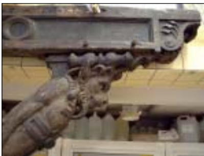
Korbeel met sater (1549). - Collectie Museum Vleeshuis, Antwerpen.

1. Afdeling Conservatie/Restauratie (C/R) van de Hogeschool Antwerpen, campus Academie. In casu de ateliers Steen o.l.v. docente Carolien van der Star en Polychromie Hout o.l.v. docent Charles Indekeu.