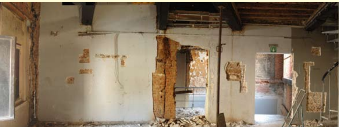
▲ Panorama van de muurarcheologisch onderzochte binnenkant van de reftergevel op de verdieping