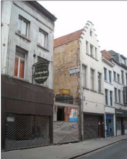
De bres ter hoogte van Klapdorp 79 (9/5/2010)

De afbraak van het pand St. Jan in't Cromhout in de loop van februari 2010 leverde als toevallig neveneffect interessante informatie op over de vroegere bouwfasen van het pand en zijn burens. Omdat de vereniging zo veel mogelijk probeert ook deze belangrijke informatie te verzamelen voor ze onherroepelijk verdwijnt, werden in sneltempo op bijna elke dag van de afbraak foto's vanaf de straat genomen – niet zo evident overigens voor mensen die ook meestal een voltijdse dagtaak hebben (waarom doet de stad dat niet?). Nadat het stof wat was gaan liggen, bleken de scheimuren een heleboel kris-kras door elkaar lopende sporen te bevatten – een hele klus om het overzicht te houden, maar een pracht van een kans tot "aandachtige muurobservatie".