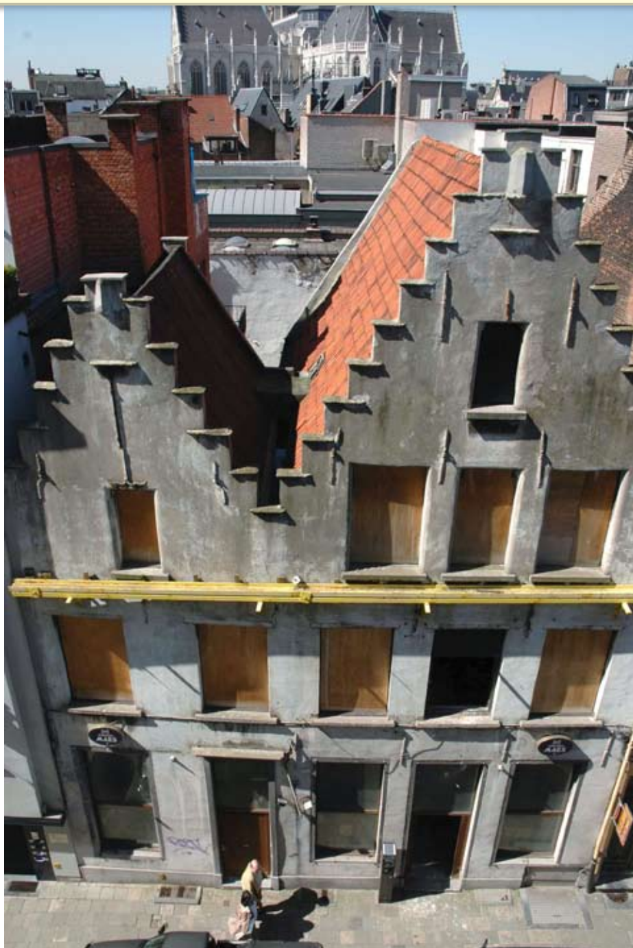
Den Cleynen en den Grooten Refter