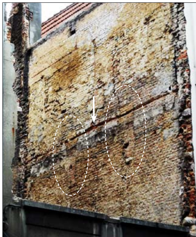
Oostelijke scheimuur van Klapdorp 79, Omcirkeld: uitbraaksporen van twee moerbalken, een aanwijzing voor een vloerniveauperhoging. Pijl: meest recente vloerniveau foto auteur, 21/2/2010