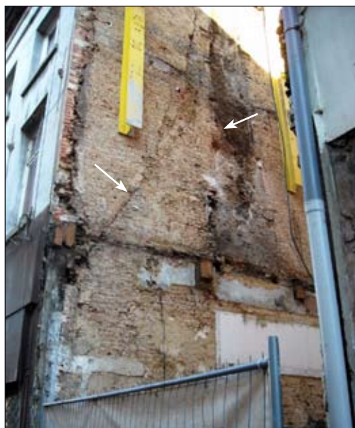
Westelijke scheimuur van Klapdorp 79, met dakhelling (eerste bouwfase?) 21/2/2010