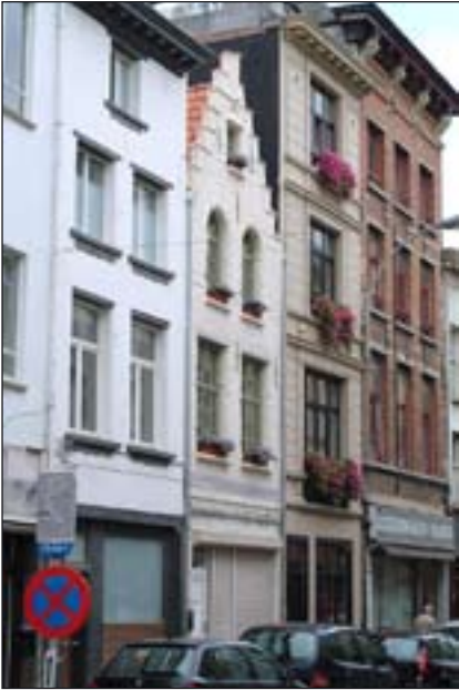
Klapdorp 69, met trapgevel.

Erg onverwacht is de ontdekking op moerbalken, strijkbalken en vlieringen van in totaal nu al bijna 20 (!) telmerken. Heel informatief daarbij is het veelvuldig voorkomen van de telmerken 8, 9 en 10, die suggereren dat het pand in een vroegere bouwfase deel moet uitgemaakt hebben van een groter geheel (mogelijk samen met de nummers 65, 67, 71 en 73).