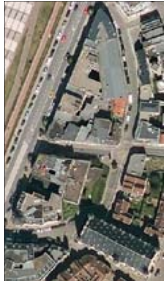
Luchtfoto van de Burchtgrachtsite vóór de campagnes van 2004 en 2007.