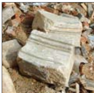
1. Balkenroostering met rode schildering. - 2. Sleutel en console met gotische profilering. - 3. Kopschotatjes met geprofileerde steunlat en latere kalkwelfselafwerking. - 4. Witstenen onderdelen van zuilengalerij.