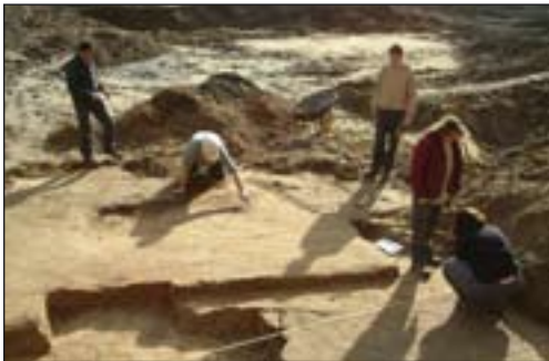
Midden: site Minderbroedersstraat 15 februari 2007.