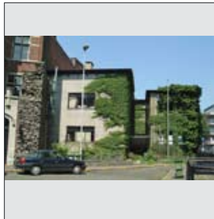
Links: virtuele voorstelling van het geplande appartementsgebouw op de plaats van het voormalige Badhuis. Ontwerp groep Blyweert; rechts: de zone Badhuis in haar huidige situatie.