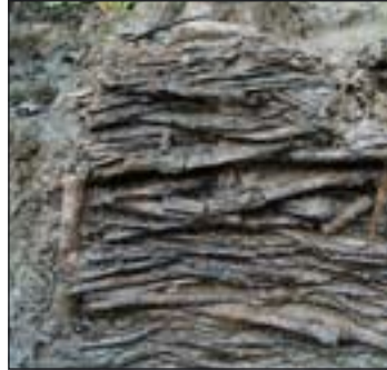
Boven: site Barreiro 10 augustus 2007, bergen van laat-middeleeuwse houtconstructies; Vlechtwerk.